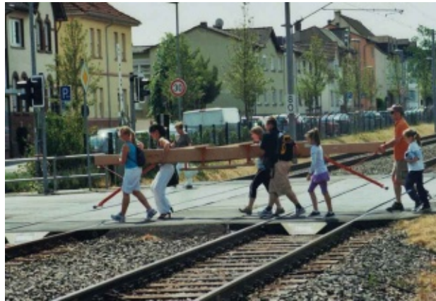
Vorfahrt für den Schwebebalken

Die Mädchen im Alter von 6 bis 12 Jahren konnten wie geplant ihren Auftritt mit „Schneewittchen“ und die sieben Zwerge starten. Im Anschluss daran zeigten sie eine kleine Auswahl ihres akrobatischen Programms zu dem Musikstück „Move it“.