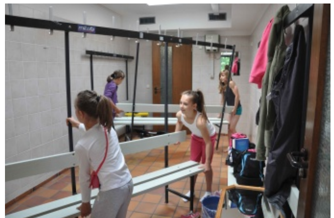
Wir können das schon allein, war die Aussage der Turnmädeln

Während die Männer schraubten, hämmerten und bohrten, sah man die Frauen mit Staubsauger und Nähadeln hantieren. Die Turnmädeln ließen es sich nicht nehmen bei ihrer Umkleidekabine selbst tatkräftig Hand anzulegen. Es gab an allen Ecken eine Menge zu reparieren und zu säubern. Inzwischen wurden sogar die Omas zum Anfertigen und Ändern von Mattenbezügen eingespannt.