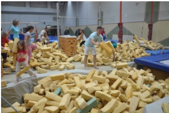
Unzählige Schnitzel wurden sortiert und die Grube gesäubert

E in Feiertag im Mai, in der Kunstturnhalle wuseln unzählige Menschen herum. Kinder, Erwachsene, Trainer, Sportlerinnen, alle haben sich Zeit genommen um Einiges zu bewegen.